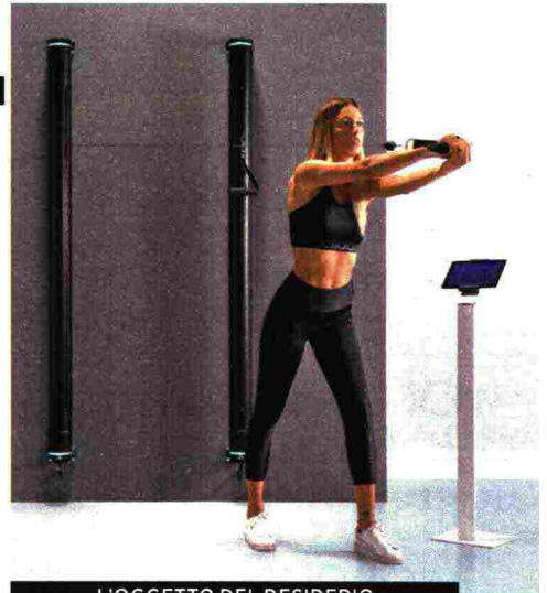
L'OGGETTO DEL DESIDERIO